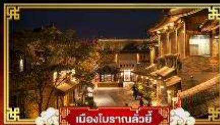
เมืองโบราณลั่วหยี่