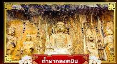
กำแพงหลงเหมิน