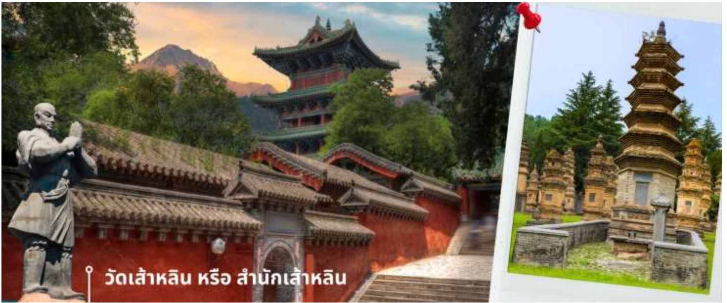
วัดเส้าหลิน หรือ สำนักเส้าหลิน

นำท่านชม ป่าเจดีย์ หรือ ถ้ำหลิน ซึ่งมีอยู่ราว 230 ที่มีความเก่าแก่ เป็นสถานที่ศักดิ์สิทธิ์ที่ตั้งอยู่ภายในบริเวณวัด ซึ่งเป็น