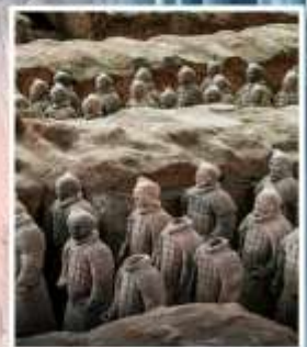
พิพิธภัณฑ์กองทัพ ใต้ดินทหารม้าจีนซี