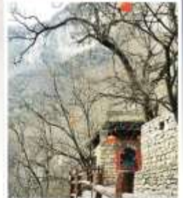
หมู่บ้านถ้ำเอ๋อเป๋อ