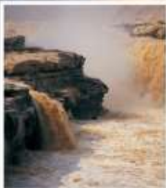
น้ำตกหูโข่ว