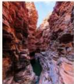
แกรนด์แคนยอนยูลาโกว