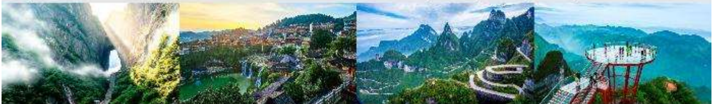
ประตูละคร