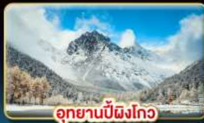
อุทยานปี้ผิงโกว