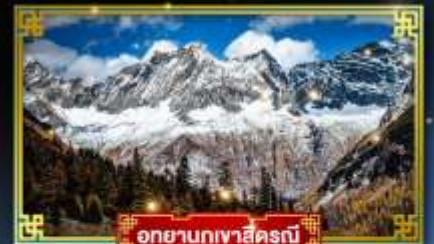
อุทยานภูเขาสีครุณี