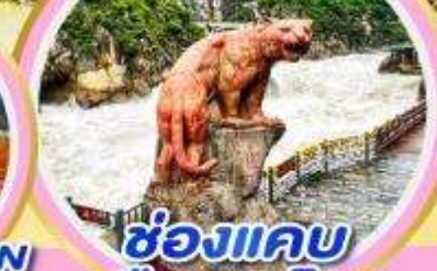
ช่องแคบ เสือกระโจน