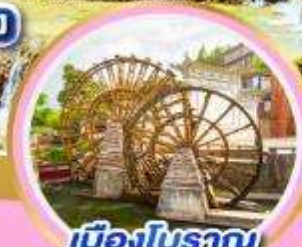
เมืองโบราณ ลี่เจียง