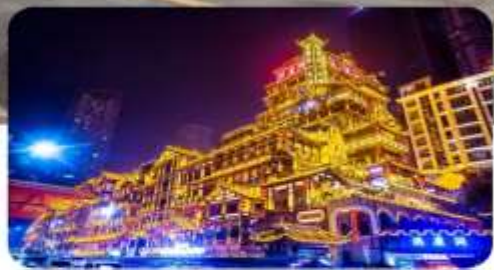
หลงหยาดง