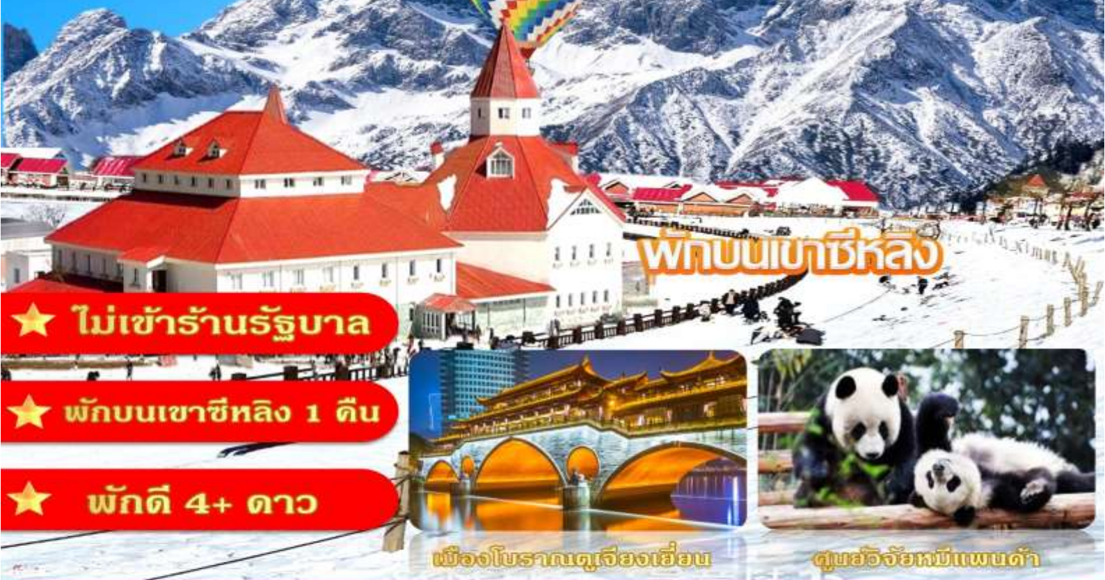
เมืองโบราณตูเจียงเยียน