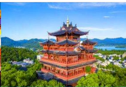
หอเจิ้งหวงเก๋อ