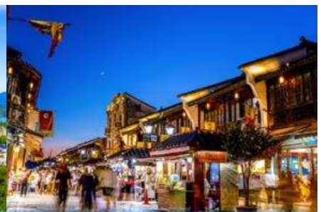
ย่านเหอฝางเจีย

วันที่สี่ นครเซี่ยงไฮ้ –เมืองหังโจว-ล่องเรือทะเลสาบซีหู-หอเจิ้งหวงเก๋อ-ย่านเหอฝางเจีย- ซ้อปิ้ง Outlet –เดินทางไปสนามบิน