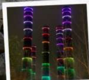
แสงสี ห้าง SKP