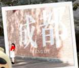
CHENGDU EASTERN MEMORY