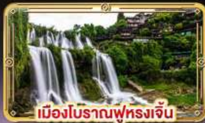
เมืองโบราณฟูหลงเจิน