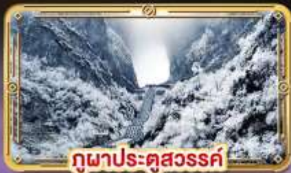
ภูเขาประตูสวรรค์