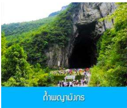
ถ้ำพญามังกร

พักที่ VIENNA HOTEL โรงแรมระดับ 4 ดาวหรือเทียบเท่าในเมืองเอินชือ