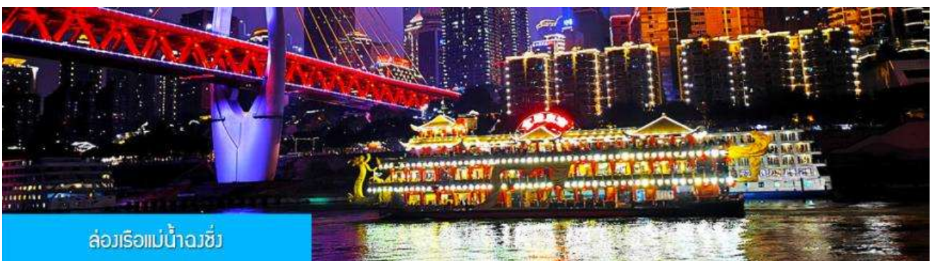
ล่องเรือแม่น้ำจิวซี

พักที่ HAITANGLIZHI HOTEL โรงแรมระดับ 4 ดาวหรือเทียบเท่าในเมืองฉงชิ่ง