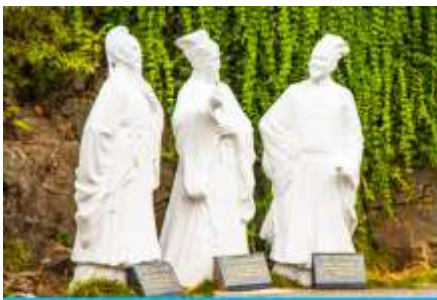
อุทยานถ้ำสามสหาย