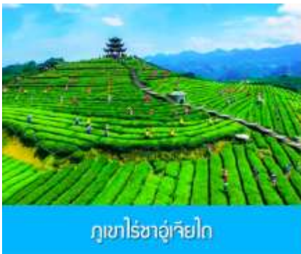
ภูเขาไร่ชาอุเจียไถ

พักที่ โรงแรม ENSHI XIPU HOTEL ระดับ 4 ดาวท้องถิ่นหรือเทียบเท่าในเมืองเอนซือ