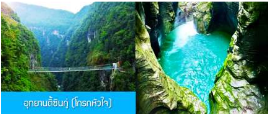
อุทยานตี้ซินกู่ (โกรกหัวใจ)

พักที่ โรงแรม ENSHI XIPU HOTEL ระดับ 4 ดาวท้องถิ่นหรือเทียบเท่าในเมืองเอินชือ