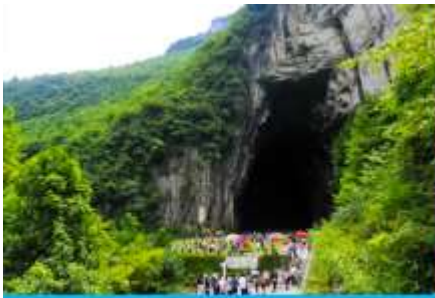
ถ้ำผญามังกร

พักที่ YICHANG HUIHAO HOTEL โรงแรมระดับ 4 ดาวหรือเทียบเท่าในเมืองหฺยิซัง