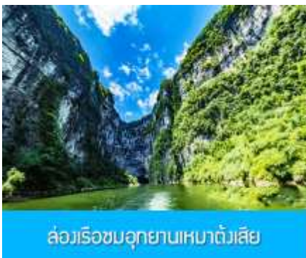
ล่องเรือชมอุทยานเหมาดังเสี๋ย