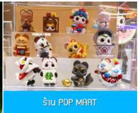
ร้าน POP MART

วันที่ห้า เมืองเอินชือ – อุทยานตี้ซินกู่ (โกรกหัวใจ) – เมืองหยีซัง – ซุปเปอร์มาร์เก็ต CBD – POP MART