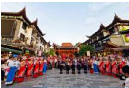
เมืองเทพริดา