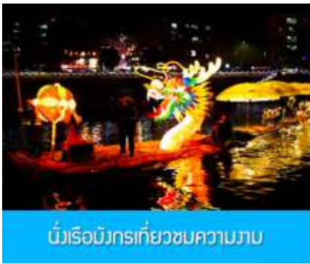
นั่งเรือมังกรเที่ยวชมความงาม