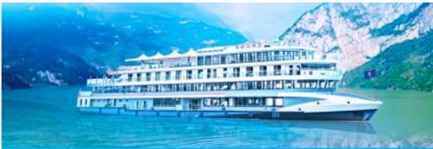
ล่องเรือชมเขื่อนสามผา