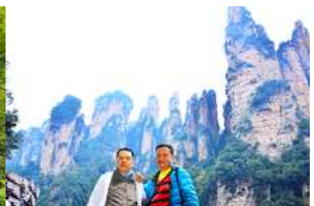
ชมจุดชมวิวลีฟก้าแก้ว