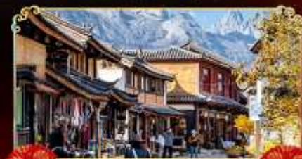
เมืองเก่าไปซา