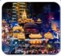
"วัดจิ่งอัน"