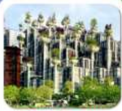
"อาคารพันต้นไม้"