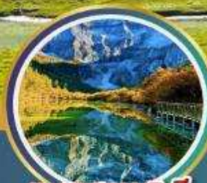
ทะเลสาบ 5 สี