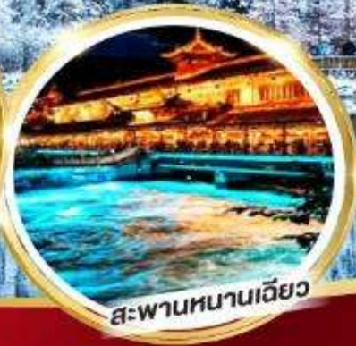
สะพานหนานเฉียว