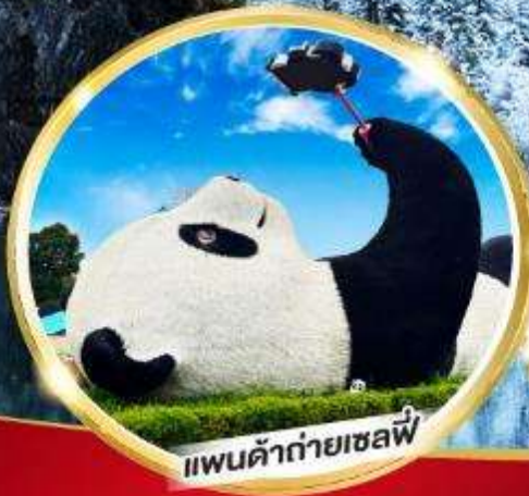
แพนด้ายักษ์เซลฟี

หมี่แพนด้ายักษ์ ช้อปปิ้ง POP MART 5วัน 4คืน