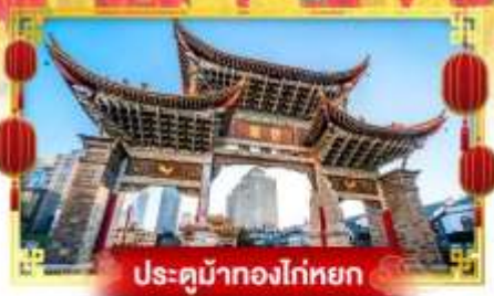
ประตูม้าทองโก่หยก