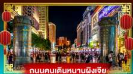
ถนนคนเดินหนานผิงเจีย

“ชมเทศกาลดอกไม้บ้านคุณนง” เที่ยวอุทยานน้ำตกเก้ามังกรสุดอลังการ