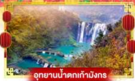
อุทยานน้ำตกเก้ามังกร