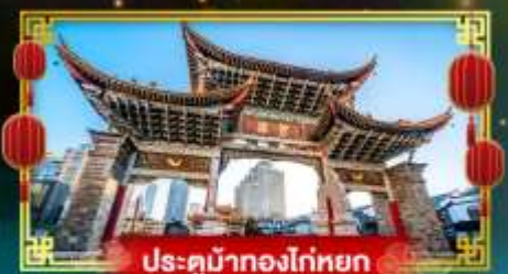
ประตูม้าทองไถ่หยก