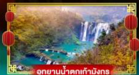
อุทยานน้ำตกเก้ามังกร