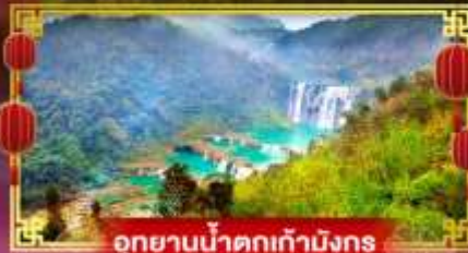
อุทยานน้ำตกเก้ามังกร