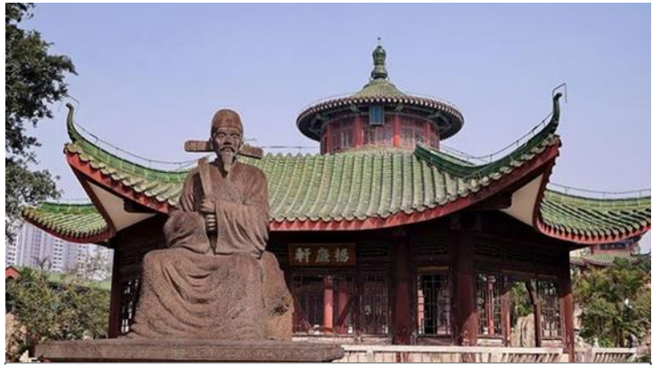
https://www.chinadiscovery.com/hainan/haikou/things-to-do.html Hairui Tomb © 海口市旅行社协会/ishar.ifeng

ถึงเมืองไห่โข่ว นำชม สุสานไห่รุ่ย (เป่าบุ๋นจิ้นไห่หล่า) Hairui Tomb 海瑞墓 ไห่รุ่ย (ค.ศ. 1514 ~ ค.ศ. 1587) เจ้าหน้าที่ผู้ซื่อสัตย์และไม่หวัหริต สุสานแห่งนี้สร้างขึ้นครั้งแรกในปี ค.ศ. 1589 ในสมัยราชวงศ์หมิง (ค.ศ. 1368-1644) โครงสร้างบางส่วนในสวนสุสานยังคงสภาพสมบูรณ์ ด้วยพื้นที่กว่า 4,000 ตารางเมตร การจัดวางสุสานได้รับการออกแบบตามระดับของตำแหน่งทางการในสมัยนั้น สถาปัตยกรรมและอาคารในสุสานไห่รุ่ย มีความเคร่งขรึมและดั้งเดิม มีซุ้มประตูหินสูงตระหง่านที่ประตูหน้า มีจารึกแนวอนว่า "ความชอบธรรมของกวางตุ้งตะวันออก (粤东正气)" ทางเดินยาวกว่า 100 เมตร ที่นำไปสู่สุสาน ปูด้วยหินแกรนิต มีการแกะสลักหิน เช่น รูปคนหิน แกะหิน ม้าหิน สิงโตหิน เต่าหินที่ยืนอยู่ทั้งสองข้าง ปัจจุบันสุสานแห่งนี้ได้รับการจัดอันดับให้เป็นมรดกทางวัฒนธรรมที่สำคัญของมณฑลไห่หล่า