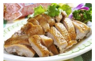
รูปเพื่อประกอบเท่านั้น

เป็ดเจี๋ยจี หรือที่เรียกกันว่า "ฟานย่า" มีกระหม่อมสีแดง ครีบกเหลือง และขนสีดำและสีขาว เนื่องจากวิธีการให้อาหารที่ไม่เหมือนใครในพื้นที่เจี๋ยจีของไห่หล่า เป็ดจึงมีหน้าอกใหญ่ หนังบาง กระดูกอ่อน และเนื้อนุ่ม มีไขมันแต่ไม่มัน สามารถลองชิมได้ในร้านอาหารเกือบทุกแห่งในชานย่า