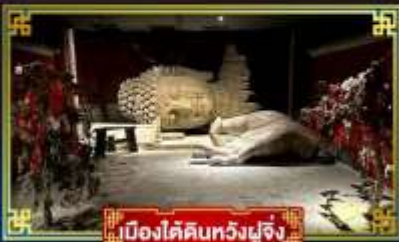
เมืองใต้ดินหวงผู่จิ้ง

“กำแพงหิมะ”...สิ่งมหัศจรรย์ของโลก พระราชวังต้องห้าม อดีตพระราชวังหลวงสุดยิ่งใหญ่