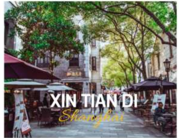
XIN TIAN DI Shanghai

ย่านใหม่ใจกลางเมืองเซี่ยงไฮ้ อีก 1 ย่านช้อปปิ้งและร้านอาหาร ร้านอาหาร ที่มีเอกลักษณ์ จากสถาปัตยกรรมที่ใช้อิฐบล็อกแบบสถาปัตยกรรมชิคเก๋มึน ซึ่งเป็นการผสมผสานกันระหว่างสถาปัตยกรรมจีนกับตะวันตกเข้าด้วยกัน ท่านจะพบกับทางเดินหิน กำแพงหิน ประติมากรรม ที่มีเอกลักษณ์ โดย 2 ทางของถนนมีต้นเมเปิ้ลตลอดทาง ยิ่งทำให้ย่านนี้มีเสน่ห์เพิ่มเป็นเท่าตัว