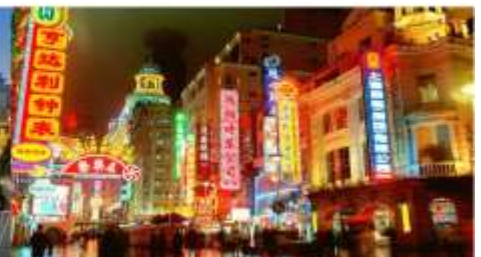
ถนนนานกิง

*ทางบริษัทฯ ขอสงวนสิทธิ์ในการสลับโปรแกรมทัวร์ตามความเหมาะสมขึ้นอยู่กับสถานการณ์หน้างาน โดยคำนึงถึงผลประโยชน์ของลูกค้าเป็นสำคัญ