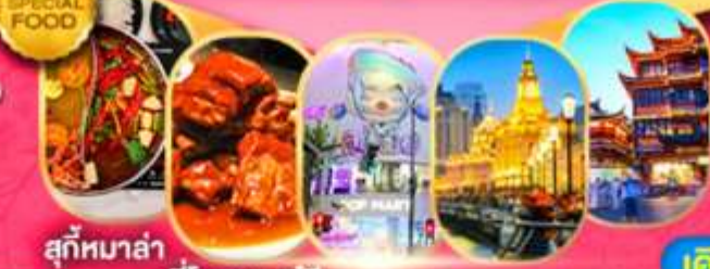
สุกัหมาล่า ซีโครงหูอู๋ซี