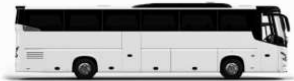
ตัวอย่างรถโดยสาร 1 คัน

ค่าที่พักตามที่ระบุในรายการหรือเทียบเท่าระดับเดียวกัน (พักห้องละ 2 ท่าน) หากประเทศห้องที่ท่านริเวสณาเดิม อาทิ เช่น ริเวสหงษ์พักเป็น TWIN BED หรือ DOUBLE BED ทางบริษัทขอสงวนสิทธิ์ในการปรับประเภทห้องพัก เป็นตามที่โรงแรมมีอยู่ โดยไม่ต้องแจ้งให้ทราบล่วงหน้า