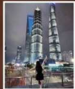
SKYWALK ลู่เจียจู่ย

รับฟรี!! ประกันสุขภาพ และ อุบัติเหตุ 2 ล้านบาท