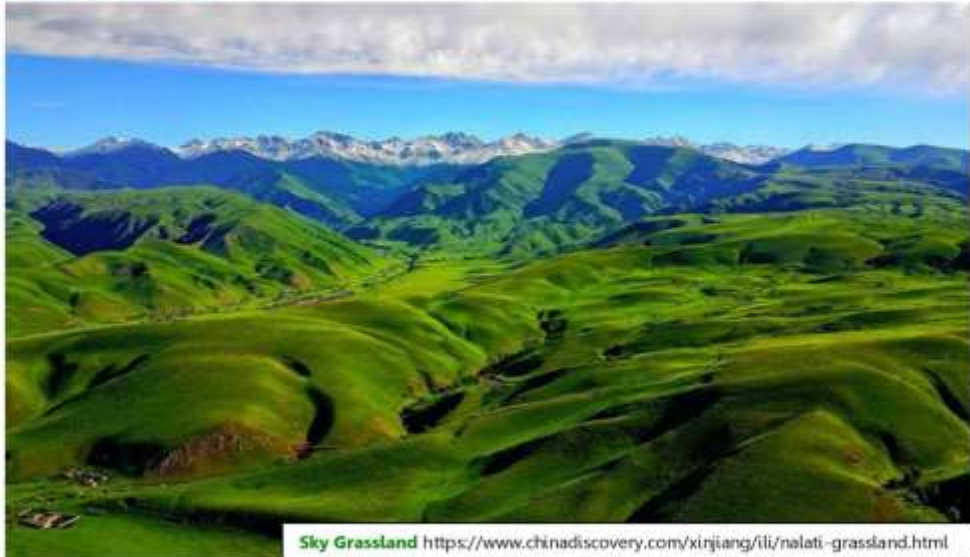
Sky Grassland https://www.chinadiscovery.com/xinjiang/li/nalati-grassland.html

หมายเหตุ 1. รถอุทยานอาจจัดเป็นรถแบดเจอร์ หรือ รถปัสไฟฟา ตามเหมาะสมหรือตามคิว ขึ้นอยู่กับการจัดการของอุทยาน 2. การใช้กระเช้าซาซันเนินเขาเพื่อชมวิว ขึ้นอยู่กับสภาพอากาศ และการพิจารณาเรื่องความปลอดภัยของอุทยานฯ หัวรถไม่สามารถจะเข้าไปเปลี่ยนแปลงได้ ถ้าอากาศไม่อำนวยตอนซาซัน อาจเพียงขอลอเวลาสลับเป็นใช้กระเช้าซาซง หรืออาจเปลี่ยนเป็นรับ-ส่งเนินเขาด้วยรถอุทยานเท่านั้น