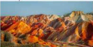
หุบเขาสายรุ้งจางเย่