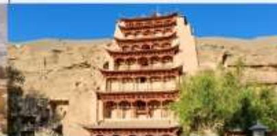
ชมถ้ำหินมั่วเกาคู

*ทางบริษัทฯ ขอสงวนสิทธิ์ในการสลับโปรแกรมทัวร์ตามความเหมาะสมขึ้นอยู่กับสถานการณ์หน้างาน โดยคำนึงถึงผลประโยชน์ของลูกค้าเป็นสำคัญ