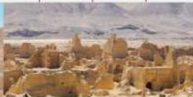
เมืองโบราณเกาซาง