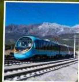
รถโฟมวีร ภูเขาหิมะมังกรหยก