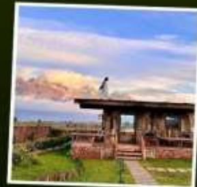
YUN DI AN CAFE