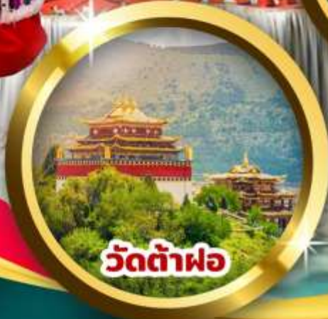
วัดต้าฝอ