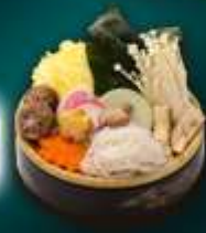
ชาบูเห็ด