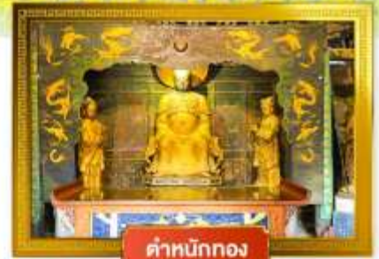
ตำหนักทอง