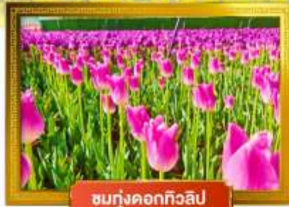
ชมทุ่งดอกทิวลิป