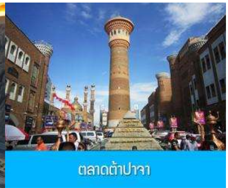
ตลาดต้าปาจา

วันที่เจ็ด แกรนด์แคนยอนตูซันจื่อ – เมืองูรูมูฉี -ตลาดต้าปาจา