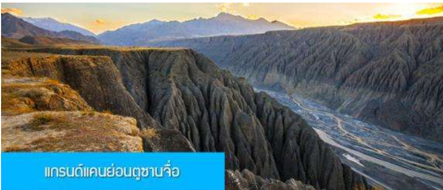
แกรนด์แคนยอนตูซันจื่อ

พักที่ RUI JING HOTEL โรงแรมระดับ 4 ดาวท้องถิ่นหรือเทียบเท่าในเมืองชุยถุน