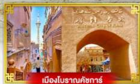
เมืองโบราณคัชการ์

เดินทางโดย : สายการบินโซนาเซาเทิร์นแอร์ไลน์