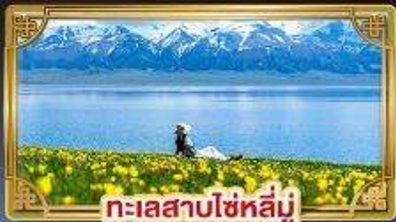
ทะเลสาบไซค์หลี่มู่