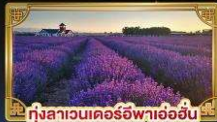
ทุ่งลาเวนเดอร์อิฟาอ้อฮัน