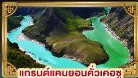
แกรนด์แคนยอนคิ้วเคอซู