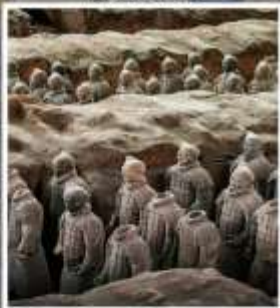
พิพิธภัณฑสถานกองทัพใต้ดิน ทหารม้าจีนซี