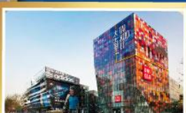
ช้อปปิ้ง SANLITUN