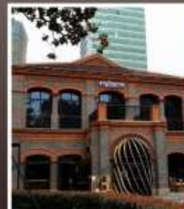
ย่านเฟิงเซินหลี่

รับฟรี!! ประกันสุขภาพ และ อุบัติเหตุ 2 ล้านบาท