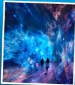
SPACE & TIME CUBE