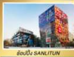
ช้อปปิ้ง SANLITUN