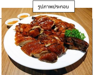
รูปภาพประกอบ

16.20 น. เดินทางกลับกรุงเทพฯ โดยสปริงแอร์ เที่ยวบินที่ 9C7485