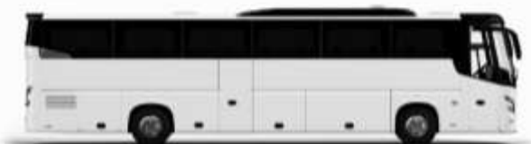
ตัวอย่างรถทัวร์ 1 คัน

ค่าที่พักตามที่ระบุในรายการหรือเทียบเท่าระดับเดียวกัน (พักห้องละ 2 ท่าน) หากประเภทห้องพักท่านริควงมาเป็นอีก เช่น ริควงห้องพักเป็น TWIN BED หรือ DOUBLE BED ทางบริษัทขอสงวนสิทธิ์ในการปรับประเภทห้องพัก เป็นตามที่โรงแรมมีอยู่ โดยไม่ต้องแจ้งให้ทราบล่วงหน้า