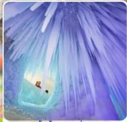
ถ้ำน้ำแข็งหมื่นปี