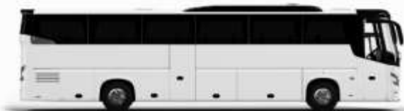
ตัวอย่างรถโดยสาร 1 คัน

ค่าที่พักตามที่ระบุในรายการหรือเทียบเท่าระดับเดียวกัน (พักห้องละ 2 ท่าน) หากประเภทห้องที่ท่านริเคลอมาเกิน อาทิ เช่น ริเคลอห้องพักเป็น TWIN BED หรือ DOUBLE BED ทางบริษัทขอสงวนสิทธิ์ในการปรับประเภทห้องพัก เป็นตามที่โรงแรมมีอยู่ โดยไม่ต้องแจ้งให้ทราบล่วงหน้า