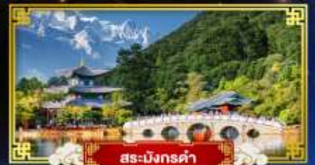
สระมิงกรคำ