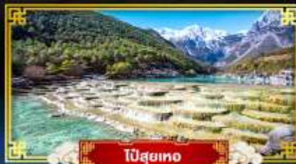
ปี่สุยเทอ