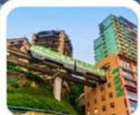
"นั่งรถไฟทะเลสาบ"