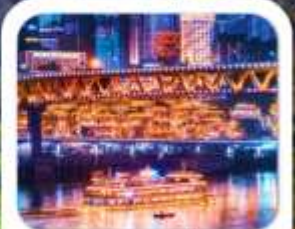
"ล่องเรือชมฉงชิ่ง"