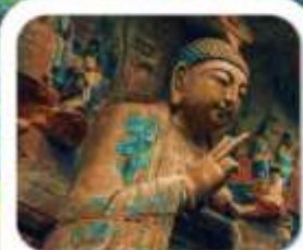
"มรดกโลกผาหินแกะสลักต้าจู้"