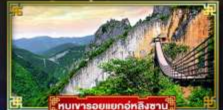
หุบเขารอยแยกอู่หลิงซาบ