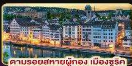
คาบรอยสหายผู้ทอง เมืองซูริค

พักซูริค 2 คืนติด พักอินเทอลากั้นท์ 2 คืนติด