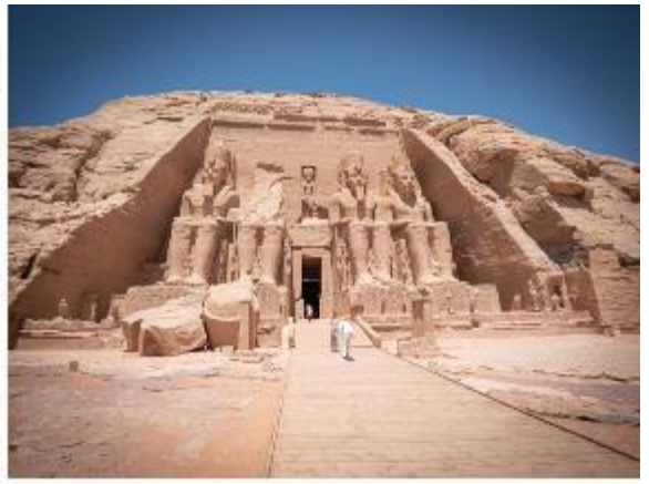
สมควรแก่เวลานำท่านเดินทางกลับเมืองอัสวาน